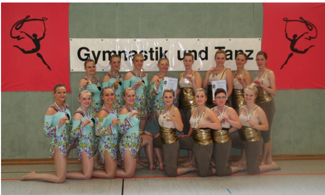
Bayerischer Meister 2011: Attitude und Bayerischer Vizemeister: Arabesque