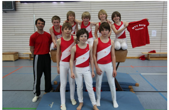
1. Runde Bayernpokal Gerätturner MTV Berg