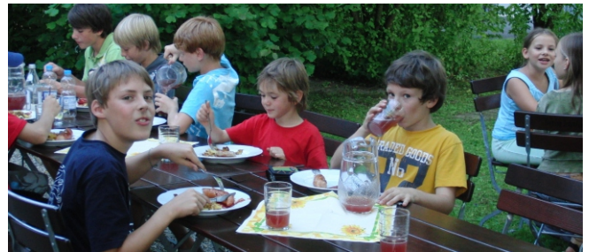
Kleine Stärkung zwischendurch