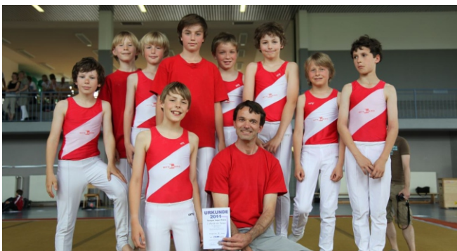
2. Runde Bayernpokal: Gerätturner MTV Berg

Die Turner des MTV Berg haben sich bei der zweiten Gau-Runde des Bayern-Pokals am 22. Mai 2011 in Germering auf ihren Plätzen etabliert: