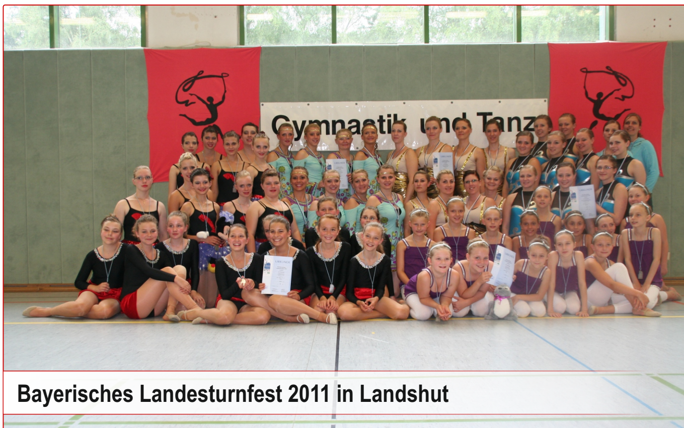
Bayerisches Landesturnfest 2011 in Landshut