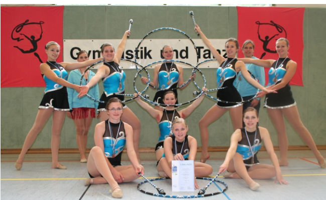
Platz 3 für Pirouette