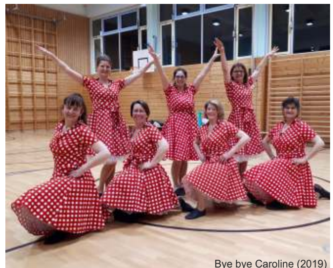
Bye bye Caroline (2019)