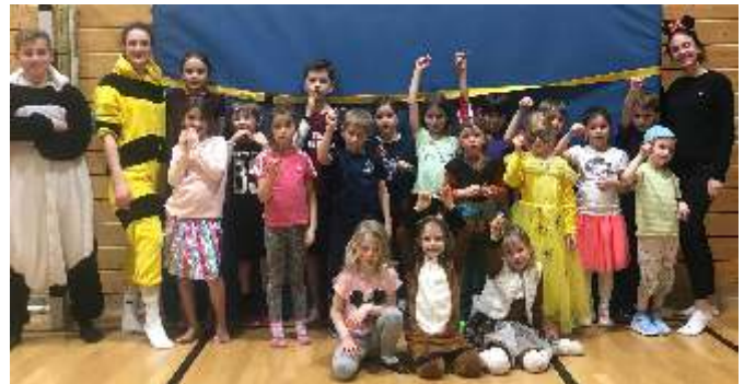
Kinderturnen ab 6 Jahre

In den „normalen“ Turnstunden schulen wir spielerisch Koordination, Kooperation und das sich entwickelnde Körpergefühl der Kinder. Es werden viele