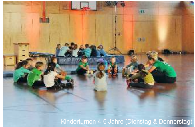
Kinderturnen 4-6 Jahre (Dienstag & Donnerstag)