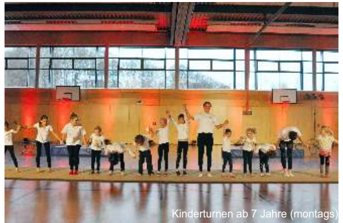
Kinderturnen ab 7 Jahre (montags)