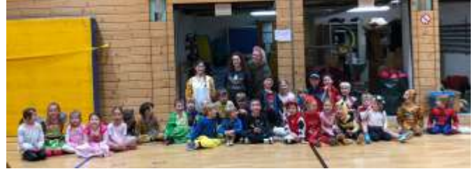
Kinderturnen 4-6 Jahre (Donnerstag)