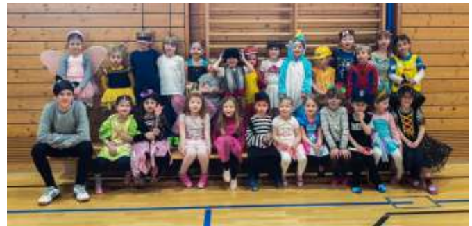
Kinderturnen 4-6 Jahre (Dienstag)