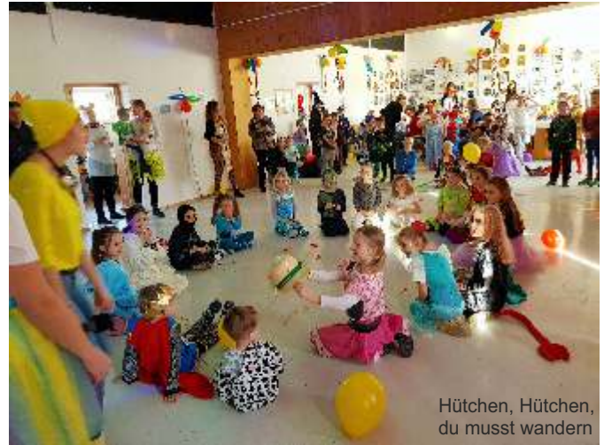
Hütchen, Hütchen, du musst wandern