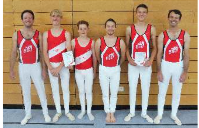
Erwachsene und Jugendmannschaft