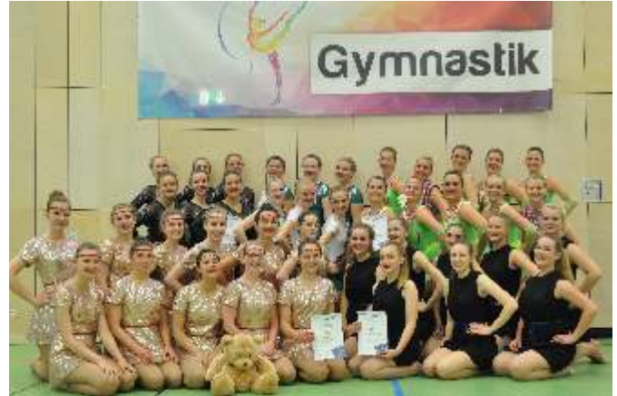
Alle Teilnehmerinnen des MTV Berg