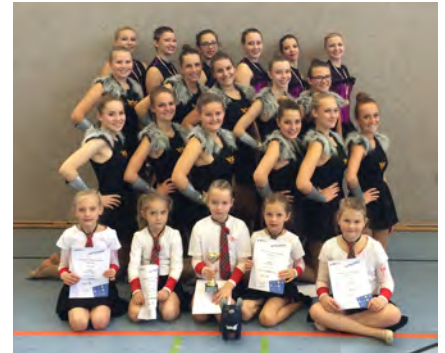
Développé, Tendü und Coupé

Die jüngsten Tänzerinnen der Gruppe Coupé trugen stolz ihren Pokal für den 2. Platz zum Motto Highschool Love nach Hause (15,58 Punkte).