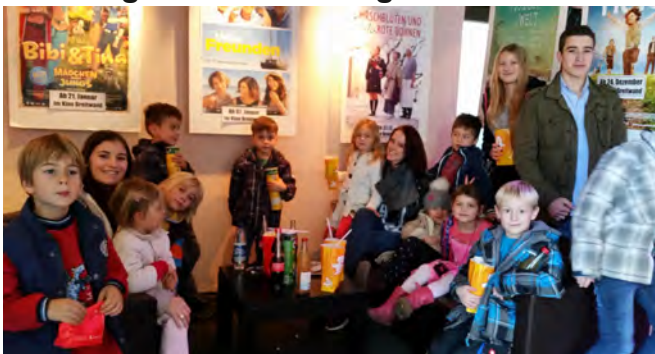
Um das erfolgreiche und sporterfüllte Jahr

2015 gebührend abzuschließen, haben wir im Dezember einen Kinofahrt mit den Kindern der Dienstags- und Donnerstagsturngruppe unternommen.