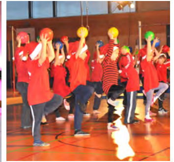
Kinderturnen Dienstag und Donnerstag