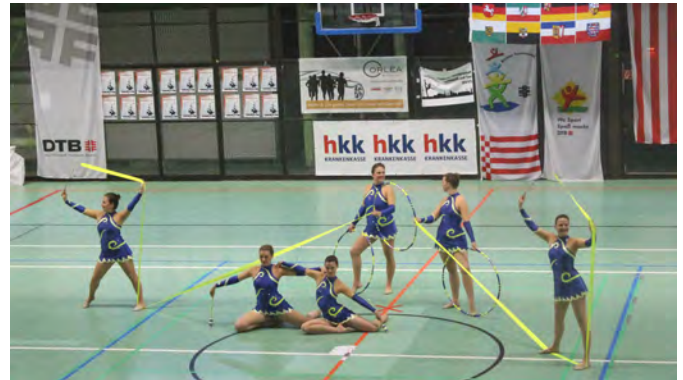
Arabesque: Gymnastik mit Reifen, Band und Keulen