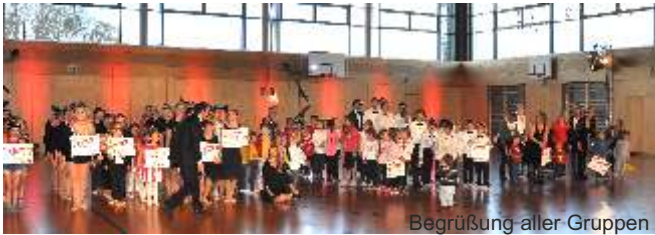
Begrüßung aller Gruppen