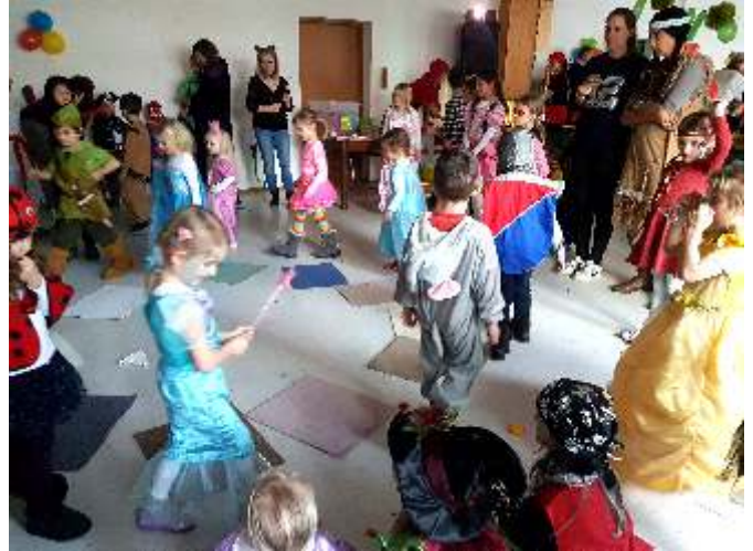
Reise nach Jerusalem

Eine lange Warteschlange sah man am Eingang vom Vereinsheim Aufkirchen am Tag unseres Kinderfaschings. Zahlreiche Kinder waren mit ihren Eltern, Omas und Opas da, passend verkleidet zum diesjährigen Motto Märchenwald . Wir erreichten einen Besucherrekord von über 200 Gästen. Beim Schubkarrenrennen oder Zeitungstanz und zahlreichen anderen Spielen wurde viel gelacht und um den Sieg gefiebert.