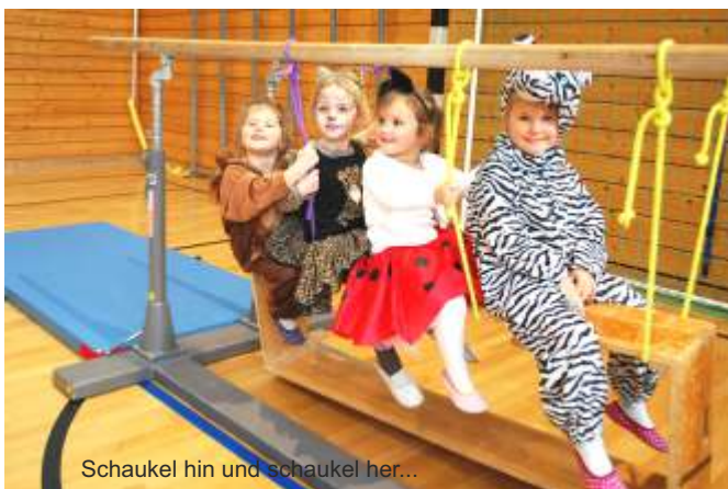
Schaukel hin und schaukel her...