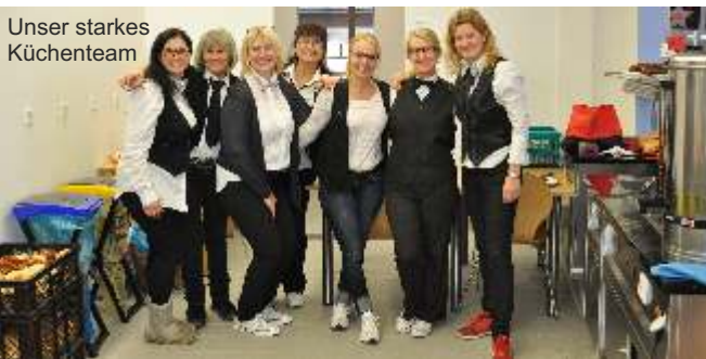
Unser starkes Küchenteam