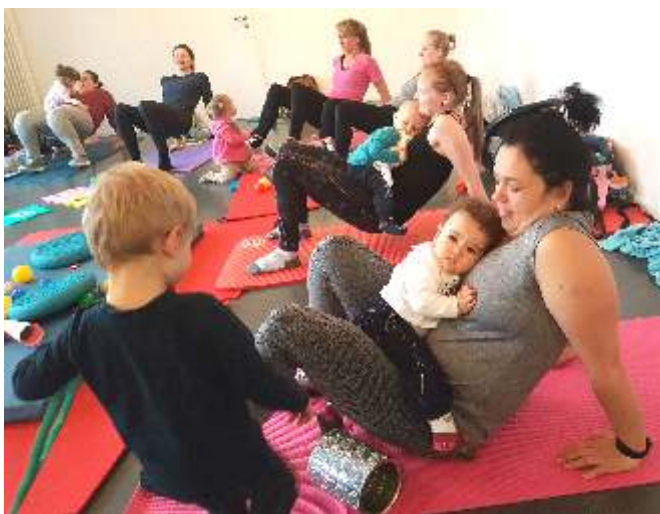
Liegestütz mit zusätzlichem Trainingsgewicht und Kuschelfaktor