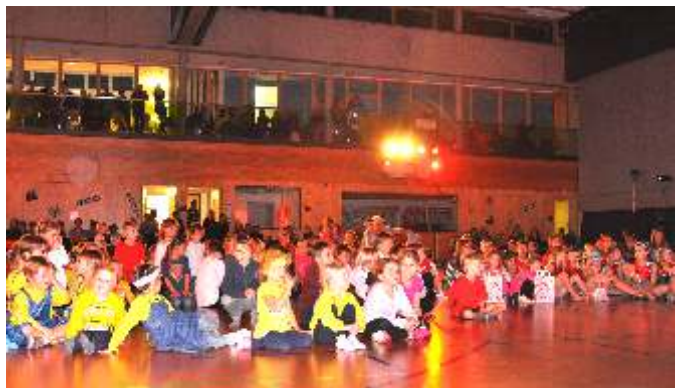
Der Nikolaus ist da!