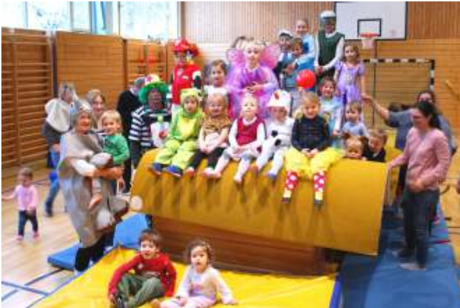
Tolle Kostüme beim Eltern-Kind Turnen

Die Kostüme bei der Eltern-Kind-Turnstunde wurden schon von den Kindern selber ausgewählt, so waren unter anderem neben den kleinen Feen und Prinzessinen auch die Eiskönigin und Olaf da sowie Marshall der Feuerwehrhund von der Serie Paw Patrol. Danke auch an die Oma Elefant und den Opa Clown, die ebenfalls kostümiert zum Turnen kamen. In beiden Turnstunden wurden die Geräte den Kostümen entsprechend aufgebaut, damit auch jedes Kind trotz Kostüm turnen konnte.