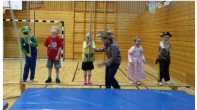
der zu motivieren.

Wie jedes Jahr dürfen sich die Kinder in der letzten Stunde vor den Faschingsferien verkleiden und es wird eine abwechslungsreiche Turnstunde mit vielen Faschingsspielen wie Zeitungstanz, Luftballontanz, Reise nach Jerusalem uvm. gehalten. Am Ende gab es für jeden noch eine Wundertüte. Dies bereitet den Kindern immer viel Freude und damit sie die auch nicht verlieren, lassen wir TrainerInnen uns immer vieles Neues einfallen, um die Kin-