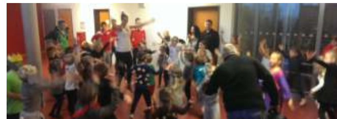
Aufwärmen zur Märchenstunde