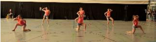
Tanz: „Männer und Frauen“