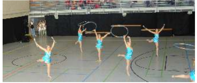
Gymnastik: „Bom, bom, bom“

Am 4./5. Oktober 2014 erturnten sich die Gymnastinnen des MTV Berg einen eindrucksvollen 7. Platz bei der Deutschen Meisterschaft Gymnastik und Tanz in Witten. Das Berger Erfolgsteam Attitude überzeugte wie gewohnt das Kampfgericht mit einer dynamischen Tanzgestaltung. Ebenso wurde die fehlerfreie Gymnastikübung mit Reifen und Keulen durch die Teilnahme am Gymnastikfinale (7. Platz) honoriert. Trainerin Annette Reisländer war besonders beeindruckt von der ästhetischen Aus-