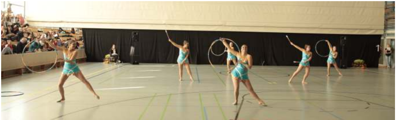
Gymnastik mit Reifen und Keulen der Gruppe Attitude