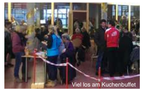
Viel los am Kuchenbuffet