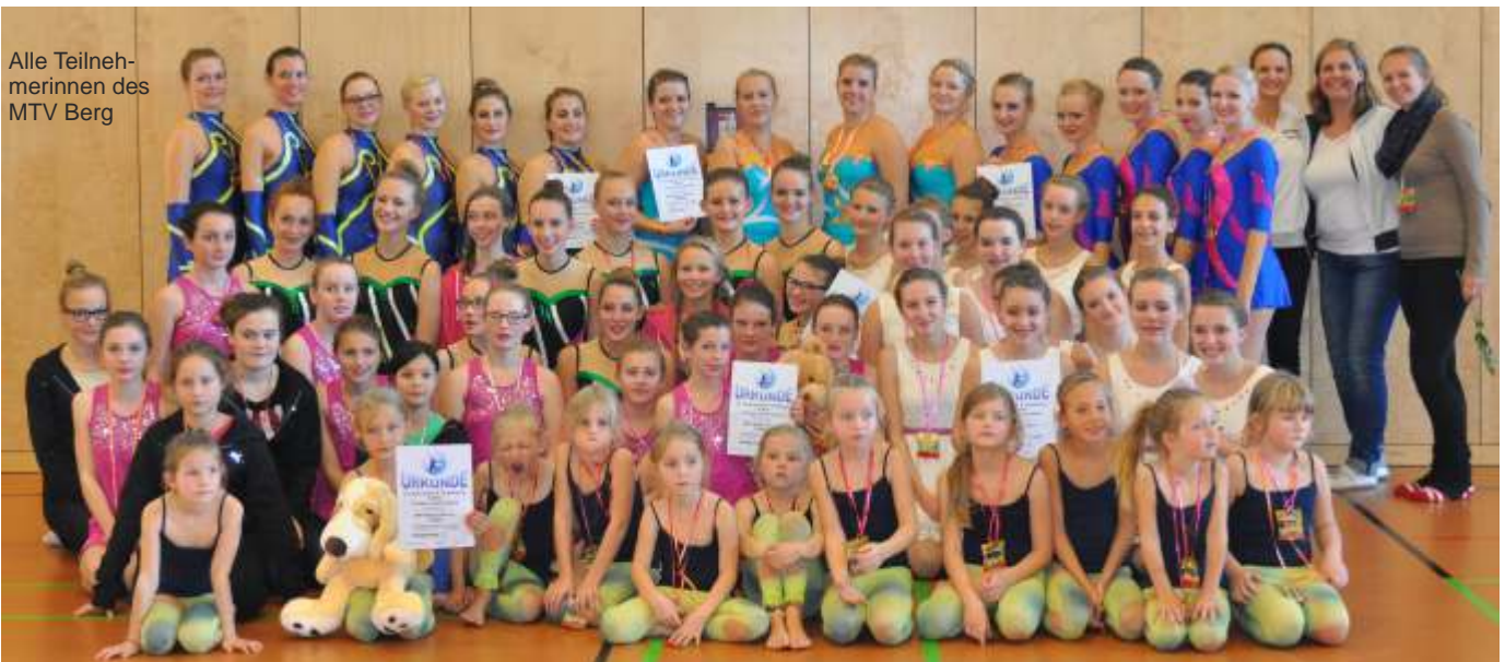
Alle Teilnehmerinnen des MTV Berg