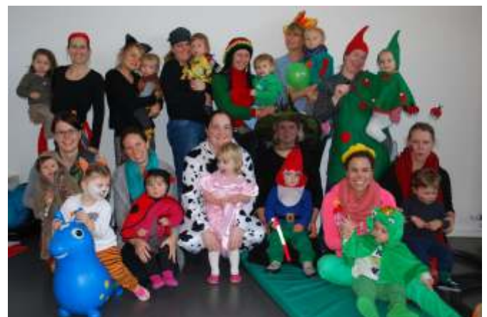
Zwergerturnen in Verkleidung